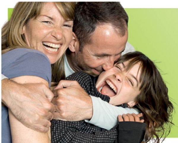
Há abraços que transformam uma vida